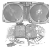
Kit de luces con conectores